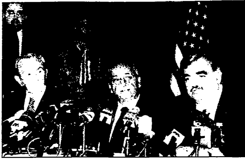
كريستوفر والحريزي ويري خلال مؤتمر صحفي مشترك في بلدة شتورة اللبنانية أمس الأول.

«الدستور» - أمين مصطفى: شهد اليوم الخامس عشر للعدوان الاسرائيلي على لبنان، كثافة نيران جوية وبحرية وبرية، أنتهت استشهاده وجرح عشرات من المواطنين، وتدمير الجسور التي تربط المناطق بالجنوب وقطع الطرق واثار تدمير عدد كبير من المنازل تدميرا كاملا.